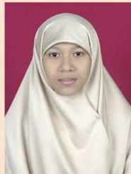
42 Mistarija, S.Sos.I., MA